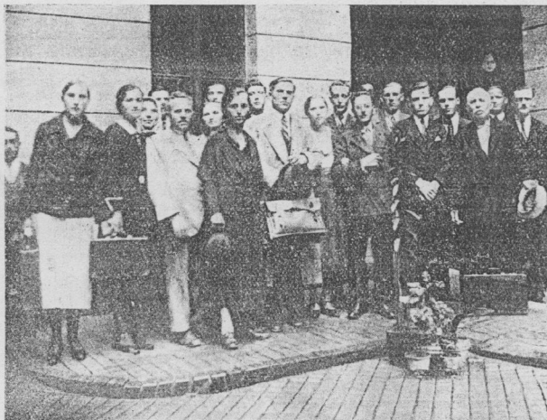
Bücsüzik a délvideki csoport.

Konferenciánk vezetője felolvassa a konferenciái jeligét (II. Korinthus 2, 14.): „Hála pedig az Istennek, aki mindenkor diadatra