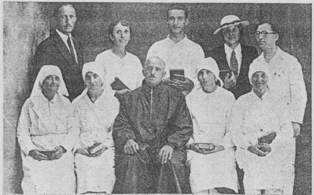
A szolnoki keresztelendők. (Lap 6. sz.)

Idéztünk az Úr Jézus véleményét hozza egy oly nép iránt.