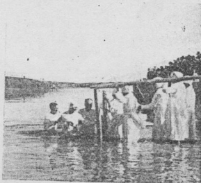
Pillanatfelvétel a Kőrös partján.

Istent nem félő, barbár, durva lelkű, sok bűnökkel agyongerhelt emberféreg amikor látja a magasba felnyúló hullámhegyeket.