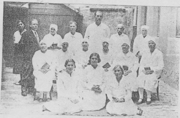
Júliusi bemerítés Budapesten.

A konferencia utolsó napján, augusztus 20-án ismét 6 fehérruhás tekintett fel hittel a golgotai keresztre és tömő-rültek a menny felé zarándokló cso-porthoz. Ez alkalommal azokat kellett bemeríteni, akik nem tudtak 18-ára közöztünk megjelenni. Sasahalom, Vár-palota, Nagykörös, Tápiószentmárton, Csömör, vidéki helyek között oszlott meg a kis csoport.